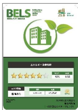
▲BELS表示マーク (ZEB Oriented)