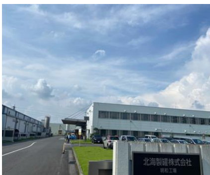
■ 北海道製罐 明和工場